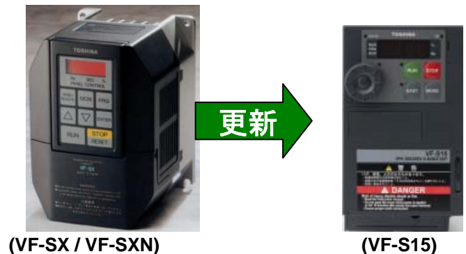
(VF-SX / VF-SXN)

VF-SX, VF-SXN に電源投入ができ、設定内容の読出しが可能であれば、パラメータ設定内容の読出し・記録を行ってください。